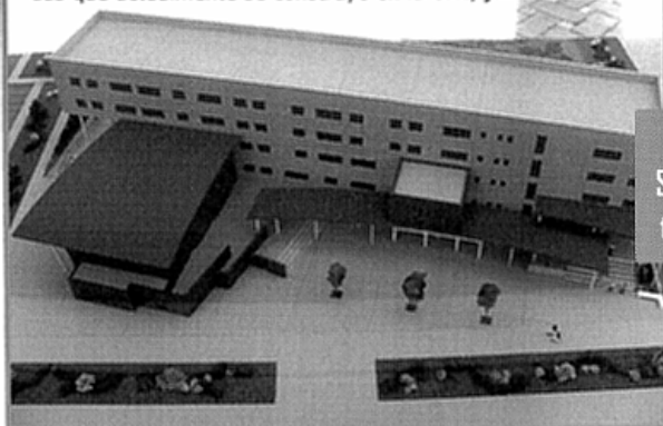
Maqueta del Edificio de la Estación Experimental de Zonas Áridas que actualmente se construye en la UAL, junto al Ciesol.

Los terrenos actualmente ocupados por el Parque de Rescate de Fauna Sahariana, detrás de la Alcazaba, vieron en 1957 los primeros ensayos con cultivos hidropónicos. Ese mismo año se desarrollaba la uva sin pepita de Ohanes.