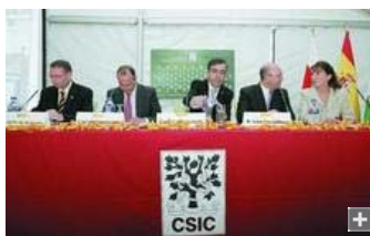
En noviembre se presentaron las actividades en conmemoración del 60 aniversario de la Estación Experimental de Zonas Áridas.

Los investigadores de la Estación Experimental de Zonas Áridas del Consejo Superior de Investigaciones Científicas (EEZA-CSIC) han obtenido en 2008 un total de 2.105.800 euros para sus actividades y proyectos. En concreto, del Ministerio Ciencia e Innovación han recibido 1.153.800 euros del Plan Nacional de I+D+i que se han empleado en programas que van a permitir conocer en profundidad los recursos naturales y el medio ambiente.