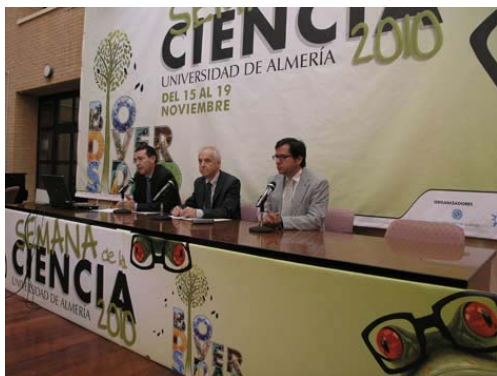
Inauguración de la Semana de la Ciencia

El bloque central de la Semana de la Ciencia, como en años anteriores, lo siguen realizando las distintas Facultades y Escuelas de la Universidad de Almería, que han preparado diversas actividades para que los alumnos amplíen sus conocimientos sobre la formación impartida en la UAL, tanto en el campo de las ciencias como en letras